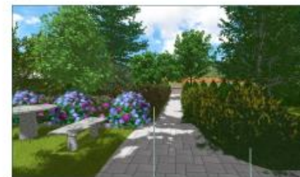
④ USCITA ZONA LIVING ESTERNO