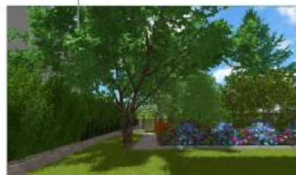
⑤ PERCORSO VERSO AREA GIOCHI