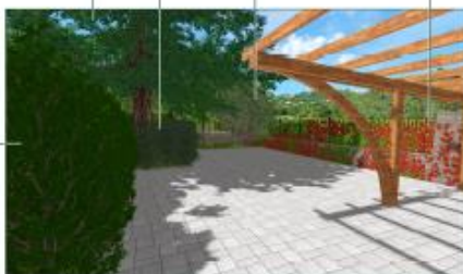
① VISTA GIARDINO DAL CARPORT