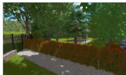
SIEPE DI PHOTINIA RED ROBIN